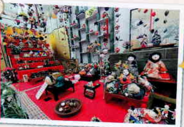
五節句のお祝い がテーマ