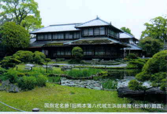
国指定名勝「旧熊本藩八代城主浜御茶屋(松浜軒)庭園」

ただいま、博物館・お祭りであん館・松浜軒のいずれかに有料入館されると他の2施設の割引チケットを差し上げています。ぜひご利用ください。