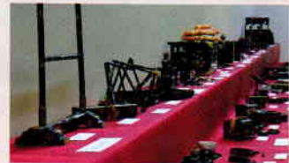
可愛らしい雛道具の数々