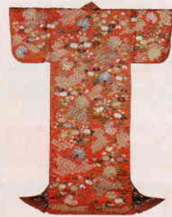
江戸時代の小袖がスラリ