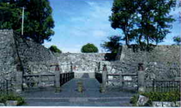
国指定史跡「八代城跡」本丸表枡形門跡