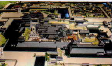
八代城城郭模型(八代市立博物館内に展示)